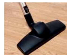
Cód. AP333 Escova articulada Flexible Curves, Ø32, 30 cm, de uso duplo aspira e dá lustro, para grés e madeira