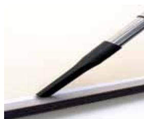
Cód. AP342 Escova para cantos, Ø 32