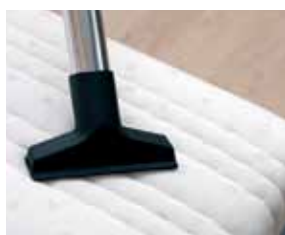
Cód. AP340 Escova para colchões e tapeçaria com feltro, Ø 32