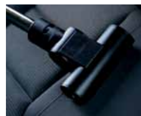
Cód. AP350 Escova turbo bate tapeçaria, Ø 32