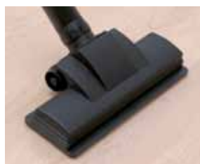
Cód. AP344 Escova para pavimento de madeira, Ø 32, 25 cm. com feltro, sem rodas