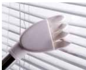
Cód. AP358 Escova para venezianas, Ø 32