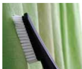
Cód. AP331 Escova para roupas, Ø32