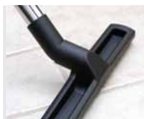
Cód. AP345 Escova universal para pavimento, com rodas e cerdas, Ø 32, 30 cm