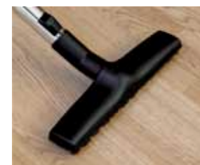
Cód. AP338 Escova para pavimento de madeira com cerdas em crina natural, Ø 32, 30 cm