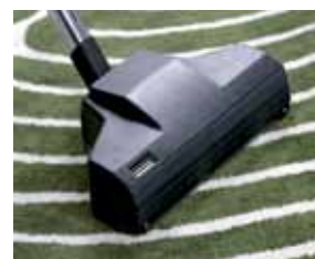
Cód. AP351 Escova turbo bate tapete-alcatifa com rodas, Ø32