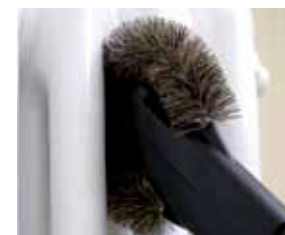
Cód. AP337 Escova para radiadores, Ø 32

Descubra toda a gama de acessórios em: www.aertecnica.com