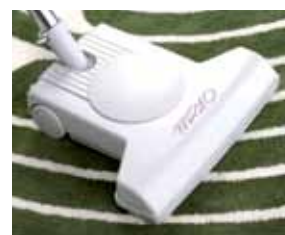
Cód. AP352 Escova turbo bate tapete-alcatifa TURBOCAT com rodas, Ø 32, 32 cm Adequada para o sector terciário e grandes superficies.