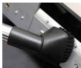
Cód. AP334 Escova articulada para limpar o pó, Ø 32