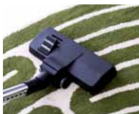
Cód. AP328 Escova de uso duplo pavimento-tapete com rodas, 27 cm, Ø32