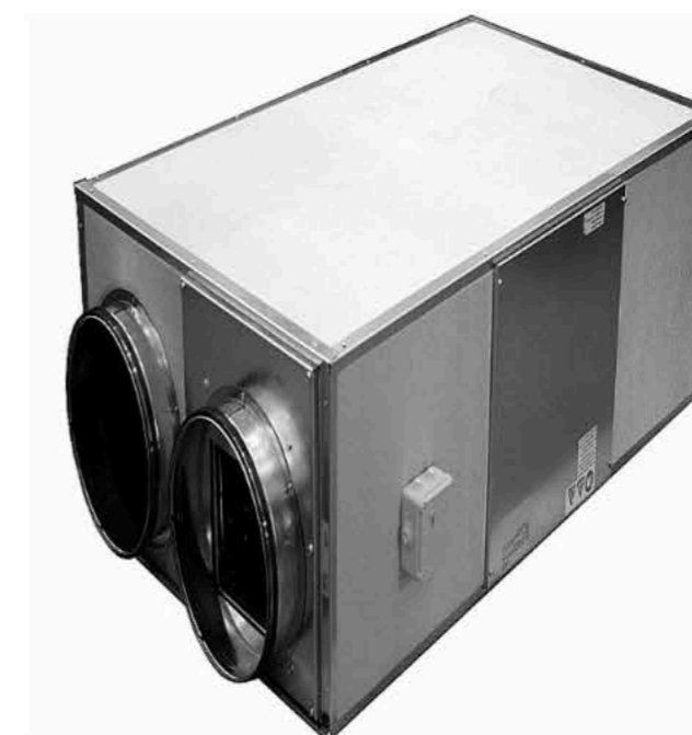
Recuperador de calor de fluxos cruzados baixo perfil CEPHIRUS LP 400 - 3500 230 - 3750 m 3 /h