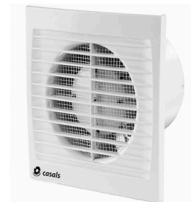
Axial registo anti-retorno LARUS 100 - 150 100 - 290 m 3 /h