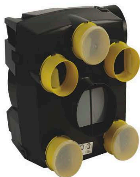
Ventilação mecânica controlada OKTOPUS 131 m 3 /h