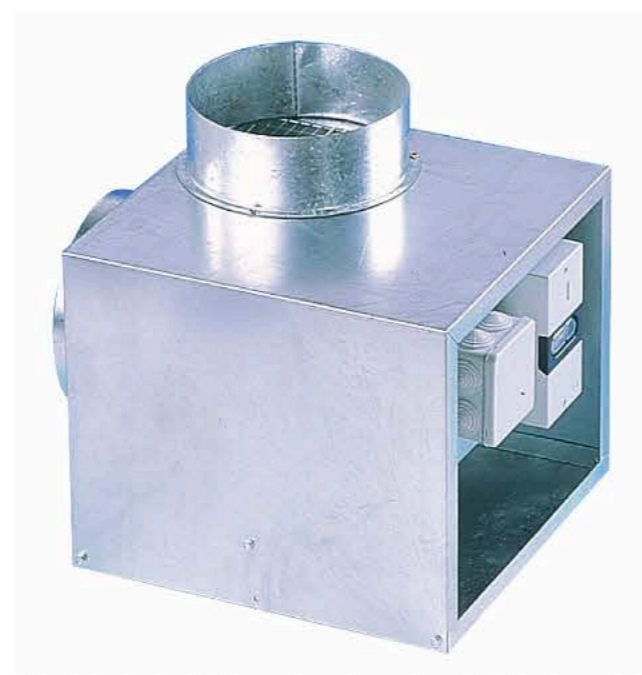
Ventilação mecânica controlada BOX SIRIUS 600 - 1200 700 - 1100 m 3 /h