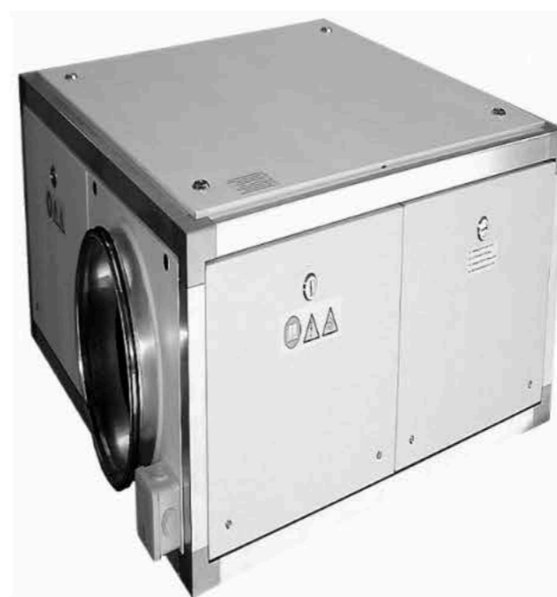
Recuperador de calor de fluxos cruzados CEPHIRUS 500 - 5600 197 - 6000 m 3 /h